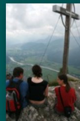
Blick ins Inntal