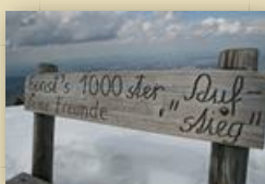
Wir waren nicht die Ersten auf dem Gipfel!