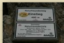
Hier fing alles an