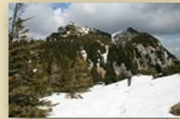
Weiter zum Hauptgipfel

Den Abstieg bewältigten wir über den an der Südostseite gelegenen Mariensteig, der überwiegend durch Wald und Geröllfelder zurück ins Tal führte. Der Weg nach unten war weniger spektakulär, aber sehr anstrengend für die Knochen. Der Abschluss dieses tollen Tages wurde durch einen großen Eiskaffee in Gmunden gebildet. Mit Sicherheit wird das nicht mein letzter Klettersteig gewesen sein.